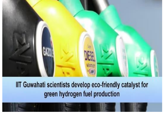
IIT Guwahati scientists develop eco-friendly catalyst for green hydrogen fuel production